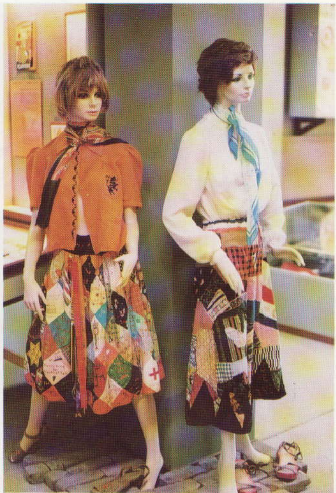
Feestrokken in het Verzetsmuseum te Leeuwarden.

Behalve het Friese Verzetsmuseum bezitten nog diverse andere Nederlandse musea exemplaren van dit naar hedendaagse maatstaven nogal curieuze politieke expressiemiddel. Het Amsterdams Historisch Museum exposeerde