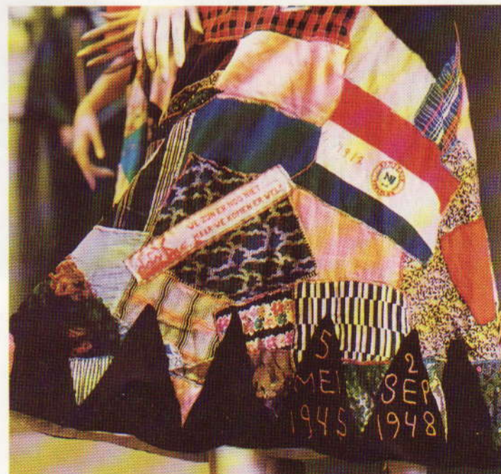
Detail rok, Verzetsmuseum Leeuwarden

De voorgestane harmonie betrof ook de verhouding tussen het maatschappelijke en het persoonlijke leven. Boissevain wilde er met de feestrok op wijzen dat de traditioneel aan vrouwen toegewezen sfeer - de huiselijke - de basis vormt van het bestaan, de basis ook van de openbare, politieke wereld.